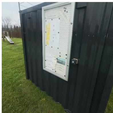
Foto af skiltning